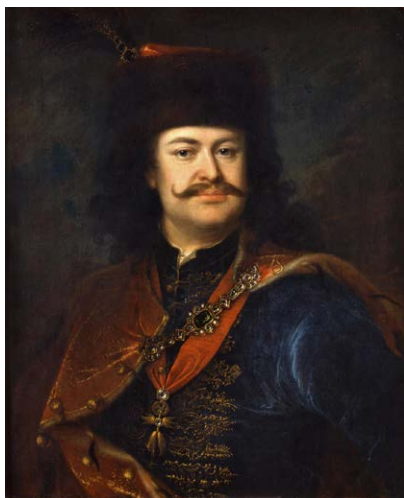
Prince François II Rákóczi

François II Rákóczi était issu d'une famille aristocratique hongroise ayant joué un rôle central dans l'histoire de la Hongrie et de la Transylvanie aux xvii e et xviii e siècles. Les Rákóczi possédaient une immense fortune foncière répartie entre la Haute-Hongrie (actuelle Slovaquie) et la Transylvanie : en 1660, leurs terres étaient regroupées en une centaine de grands domaines représentant environ trente mille tenures, soit plus de cent mille sujets. En 1682, leur patrimoine rivalisait avec celui des familles Thököly et Eszterházy, ce qui explique que la noblesse transylvaine ait à plusieurs reprises élu un membre de la maison Rákóczi prince souverain.