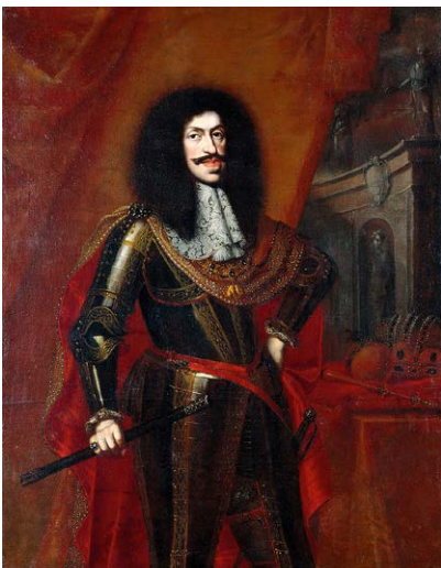
Portrait de l'empereur Leopold Ier

François Ier Rákóczi (1645-1676), fils de Georges II, ne put être élu prince et se retira sur ses domaines de Sarospatak. Il complota contre l'empereur Léopold I er et ne sauva sa tête, en 1671, qu'au prix d'une lourde amende. Élevé par les jésuites et catholique, le jeune prince prit en 1702 la tête d'une vaste insurrection nationale. Alliée de Louis XIV, la révolte lui valut en 1707 l'élection comme prince de Hongrie, mais sa tentative échoua en 1711, le contraignant à l'exil, où il mourut sans jamais revoir sa terre natale.