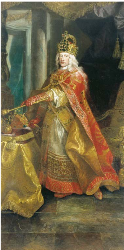
Portrait de l'empereur Joseph Ier

Cette politique plaçait Louis XIV dans une position délicate, puisque Rákóczi était vassal de Léopold Ier, roi légitime de Hongrie.