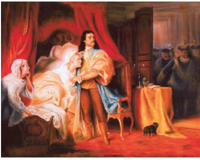
1701 - arrestation à Nagysáros

Sa présence à la cour de Louis XIV, délicate pour le roi en quête de paix avec l'empereur, l'obligea à rester incognito sous le nom de « comte de Saaros ». Il s'installa dans la région parisienne, d'abord à Chaillot, puis à Passy et Clagny. Grâce à des liens familiaux et à l'appui de la cour, notamment l'épouse du marquis de Dangeau, il obtint une pension royale substantielle, d'au moins 75 000 livres par an (1,4 million d'euros).