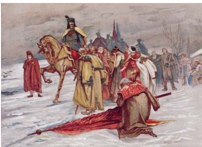
1711 - départ vers l'exil

Malgré cet échec, Louis XIV reconnut Rákóczi comme prince de Transylvanie le 18 mai 1705 et put ainsi traiter avec lui. Néanmoins, les États confédérés restaient soumis aux Habsbourg, limitant la liberté politique de la Hongrie et compliquant toute négociation de paix. Face aux blocages, Rákóczi convoqua une nouvelle Diète à Ónod le 22 janvier 1707, où il fut déclaré roi de Hongrie. Il chercha à conclure une alliance avec la France, refusée par Louis XIV. La diplomatie française tenta alors d'orienter la politique du prince, en empêchant des négociations favorables aux Habsbourg et en encourageant des rapprochements avec la Suède, la Pologne, la Russie ou l'Empire ottoman.