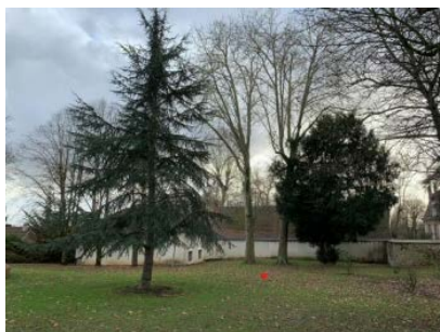
Grosbois/Yerres : Rares vestiges du couvent