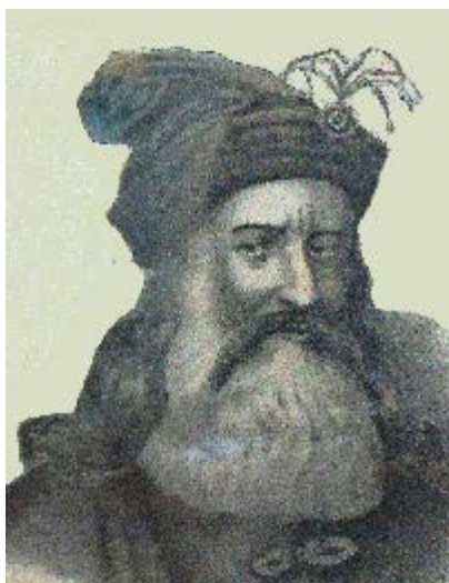
Prince Georges Ier Rákóczi

François II Rákóczi était issu d'une famille aristocratique hongroise ayant joué un rôle central dans l'histoire de la Hongrie et de la Transylvanie aux xvii e et xviii e siècles. Les Rákóczi possédaient une immense fortune foncière répartie entre la Haute-Hongrie (actuelle Slovaquie) et la Transylvanie : en 1660, leurs terres étaient regroupées en une centaine de grands domaines représentant environ trente mille tenures, soit plus de cent mille sujets. En 1682, leur patrimoine rivalisait avec celui des familles Thököly et Eszterházy, ce qui explique que la noblesse transylvaine ait à plusieurs reprises élu un membre de la maison Rákóczi prince souverain.