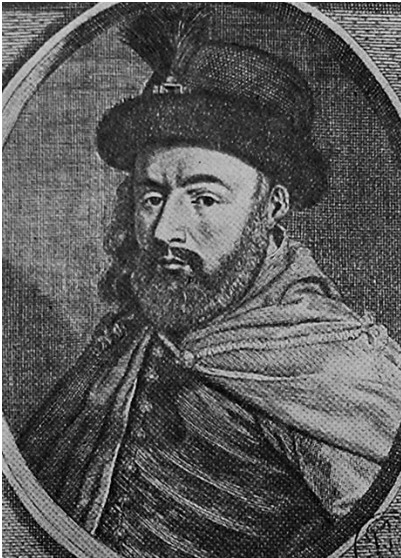
Prince Georges II Rákóczi

Son fils, Georges II Rákóczi (1621-1660), eut des ambitions encore plus vastes : il s'engagea aux côtés de la Suède dans la guerre du Nord, tenta de conquérir le trône de Pologne, se heurta à l'hostilité de la Porte et fut finalement défait en Ukraine, perdant ainsi son pouvoir. La Transylvanie cessa alors d'être le bastion de la nation hongroise.